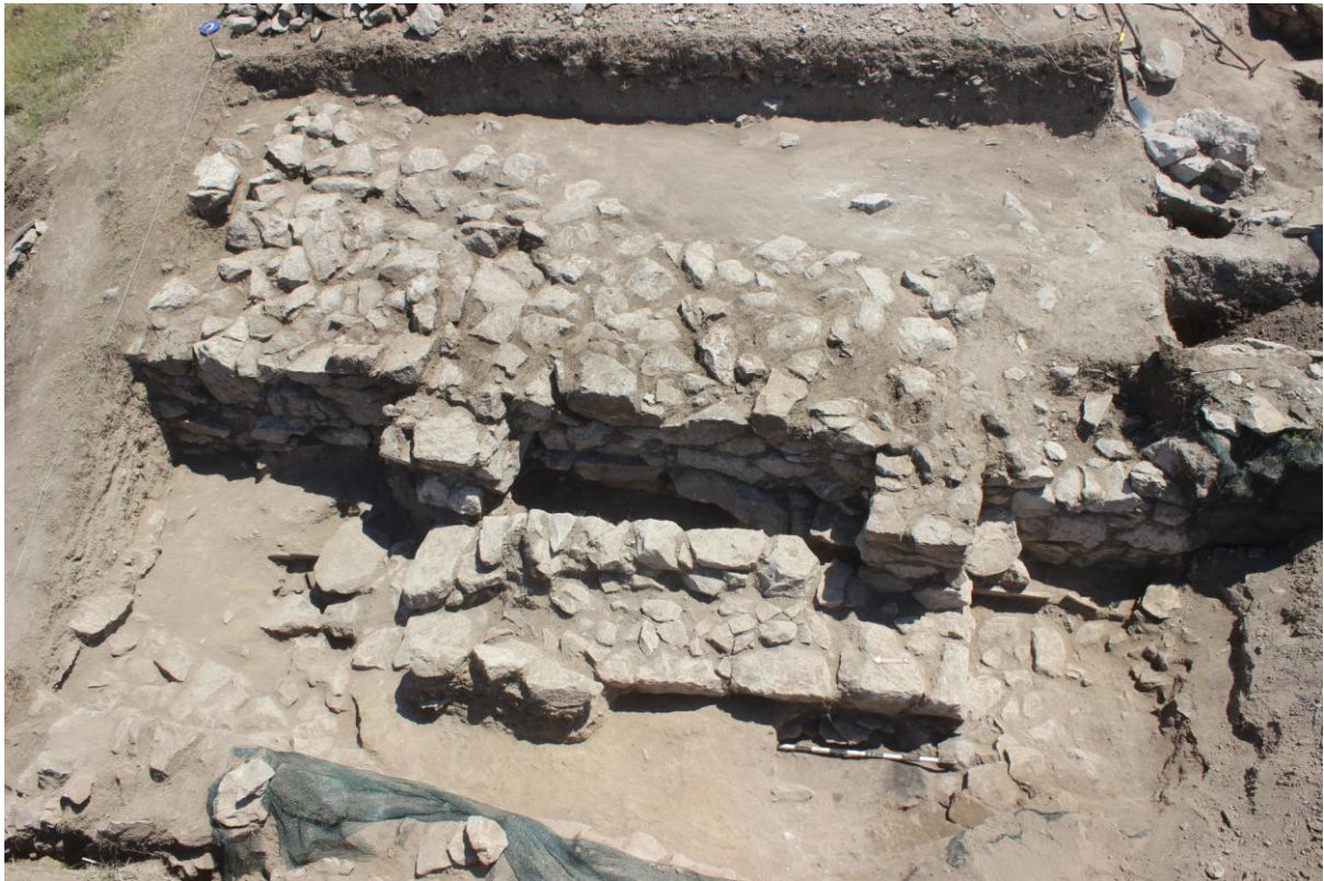
15. Сонда 26/20, на крај од ископување, од запад