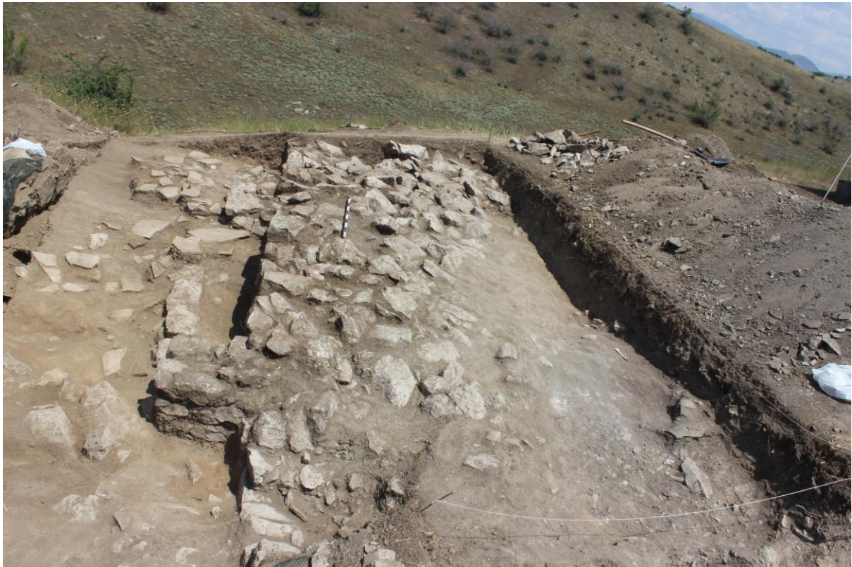
9. Сонда 26/20, поглед на сидот со пиластри, од југ