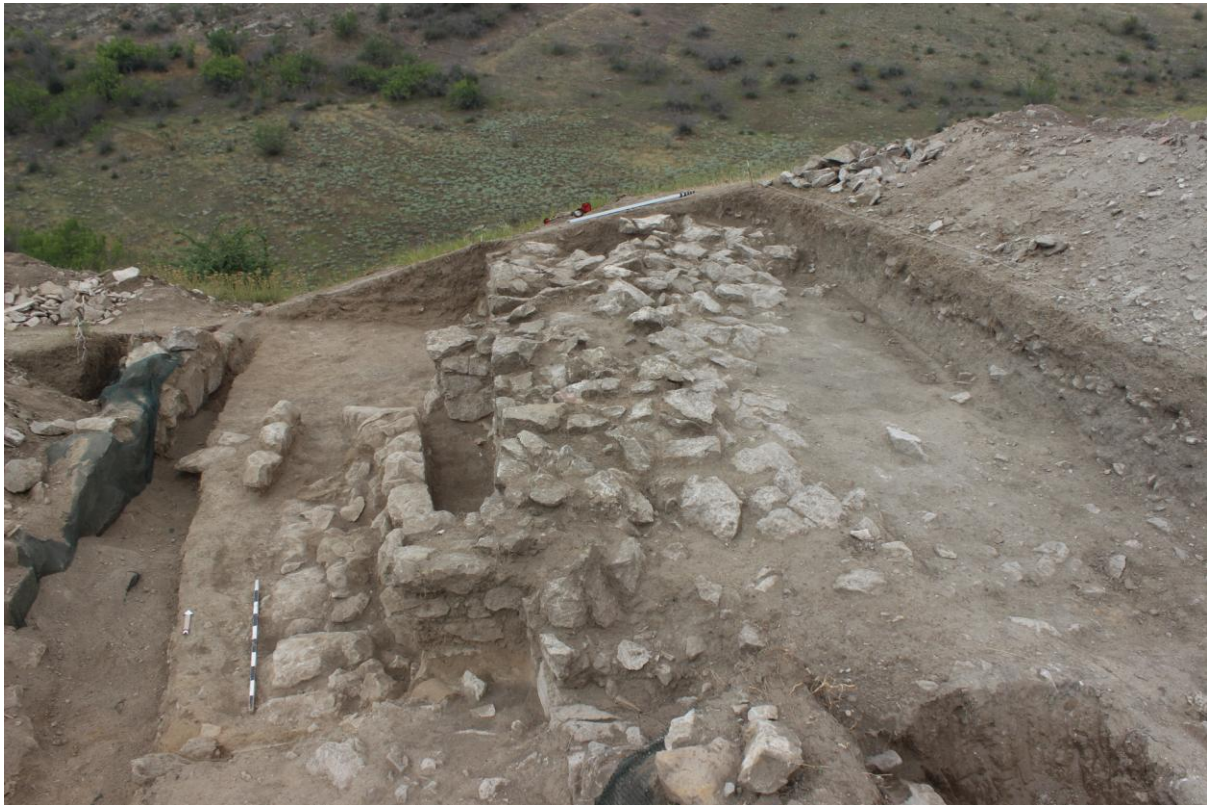
11. Сонда 26/20, под рушевинскиот слој, од југ