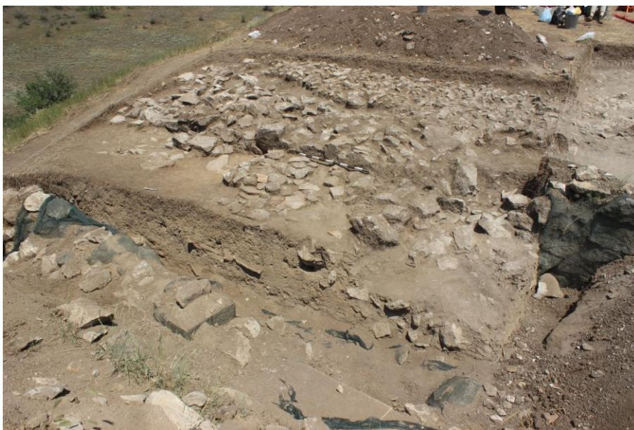
6. Сонда 26/20, од југозапад