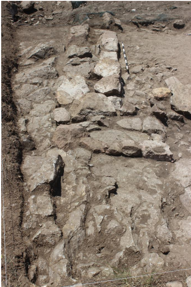
5. Сонда 25/20, вид од исток