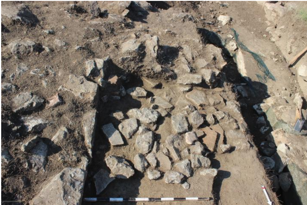
4. 26/20, ниво на тегули и камен, од север