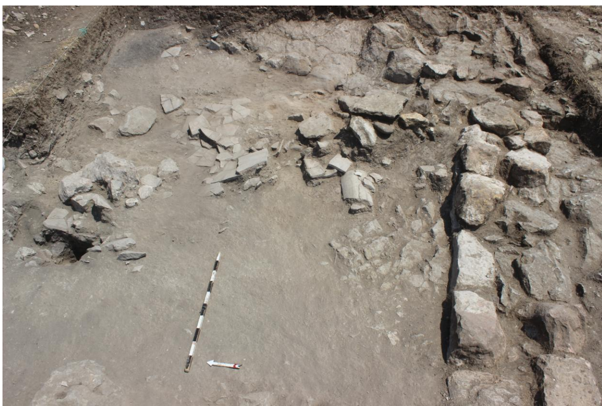
8. Соңда 25/20, од запад