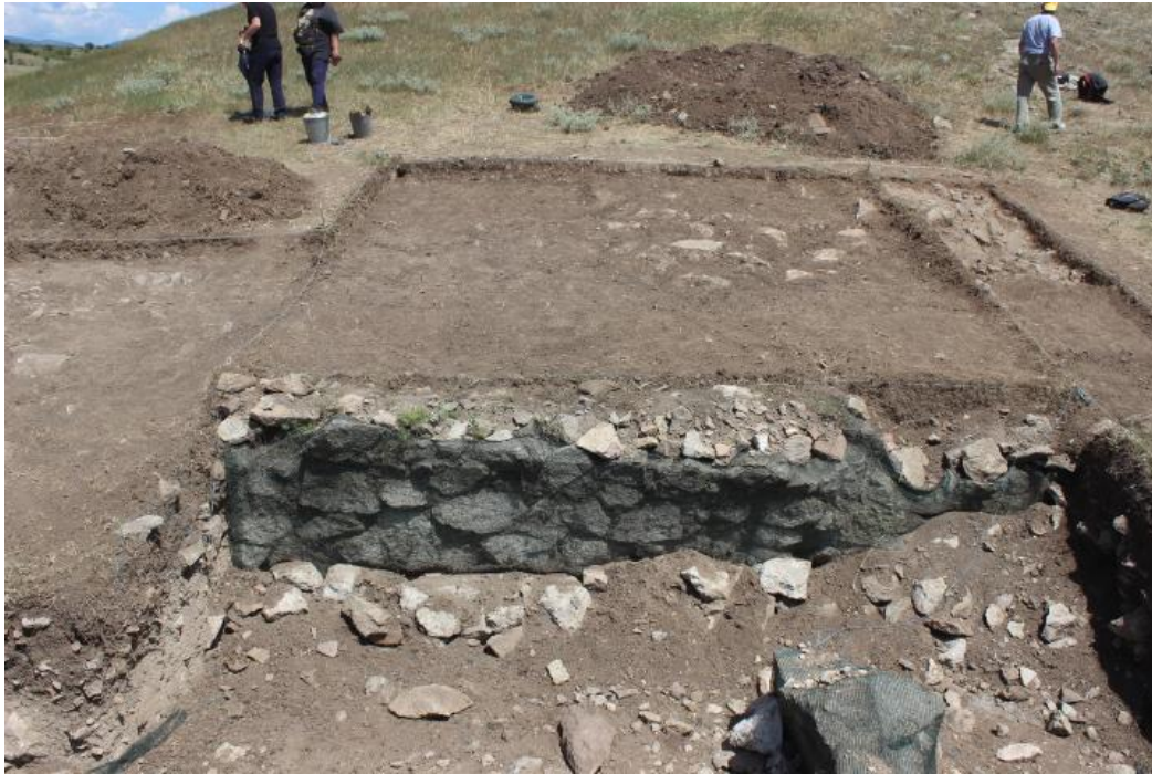
1. Сонда 25/20, од запад