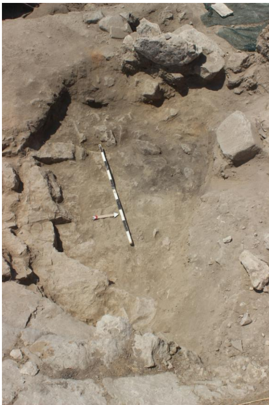
16. Сонда 25/20, на крај од ископување, детаљ