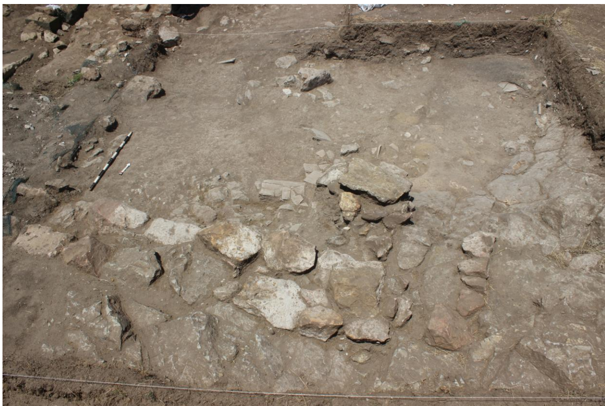
7. Соңда 25/20, од југ