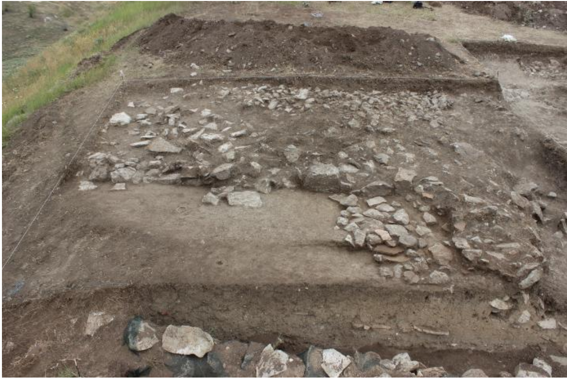
3. 26/20, од запад