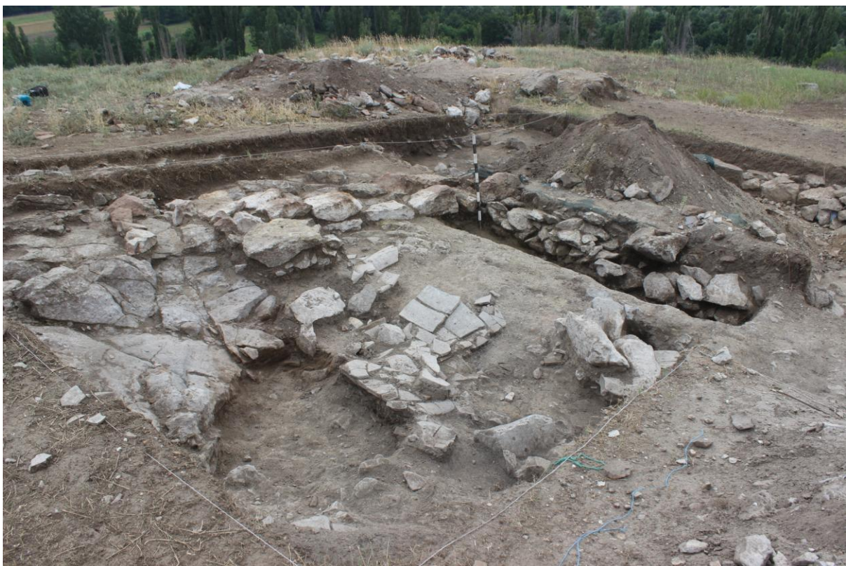
12. Сонда 25/20, рушевински слој, од североисток