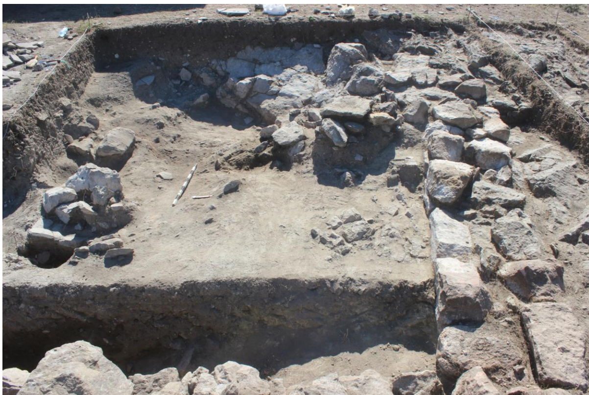
13. Сонда 25/20, под рушевински слој, од запад