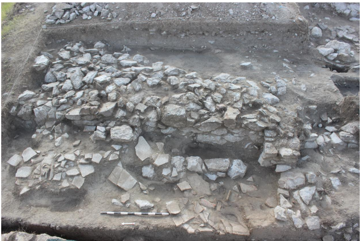
10. Сонда 26/20, рушевински слој, од запад