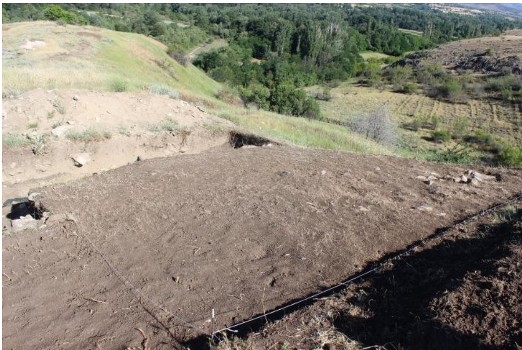
2. Сонда 25/20 од југоисток