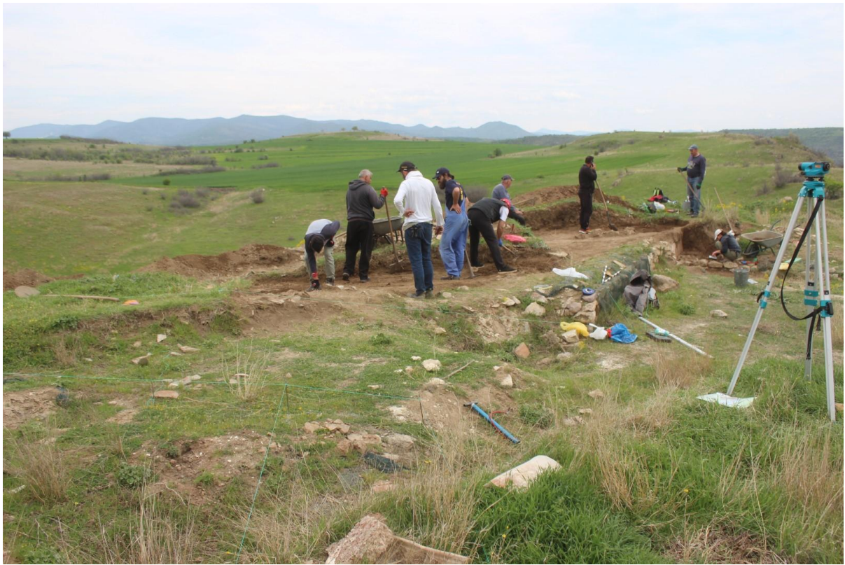
1. Соңди 33 и 34, на почеток на ископување