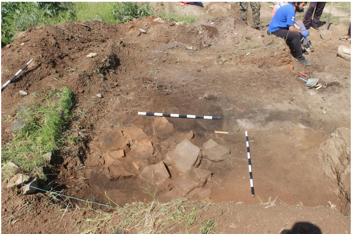
18. Соңда 37, рушевински слој