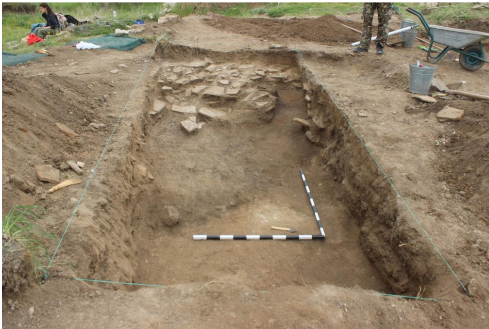
14. Сонда 35, рушевински слој (горе) и подно ниво во преден план