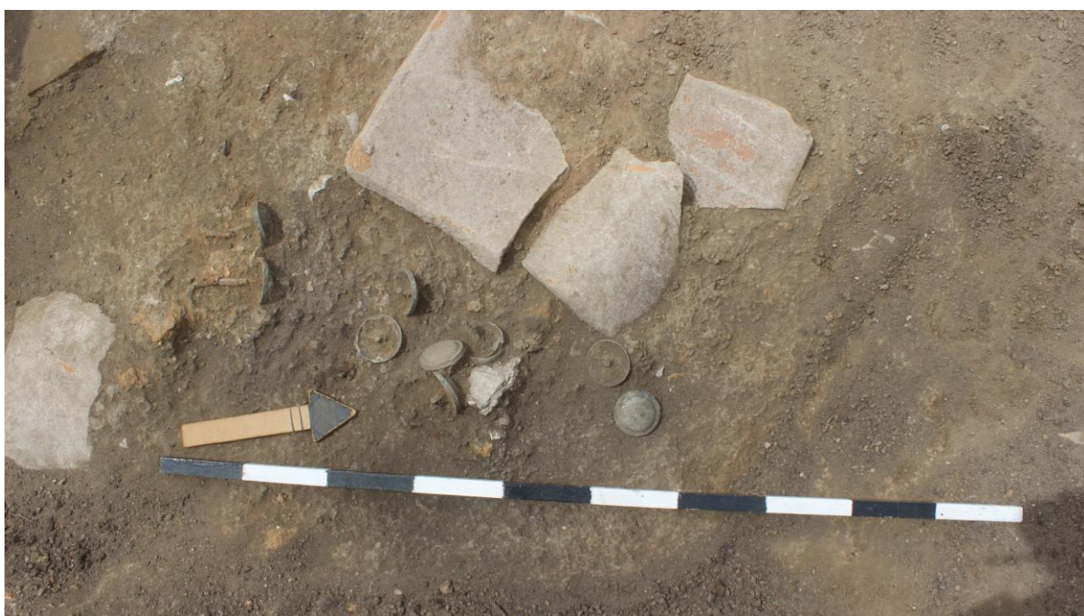
7. Сонда 33, аплики за врата