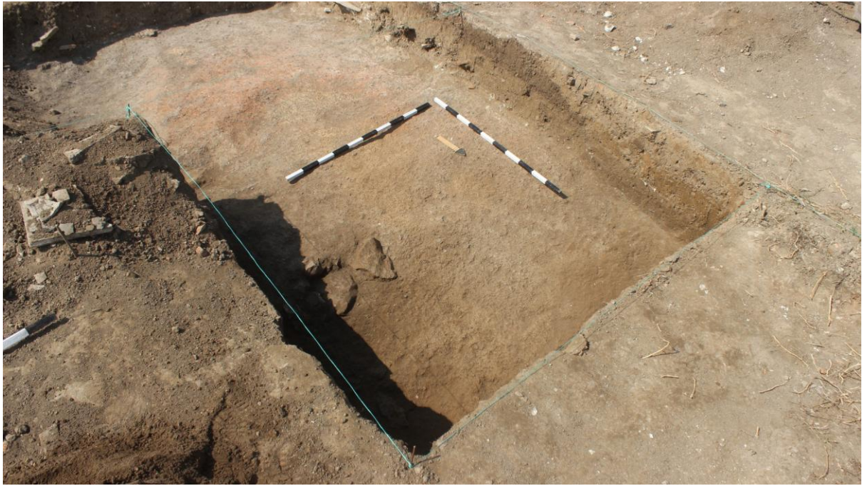
15. Сонда 35, проширена кон север