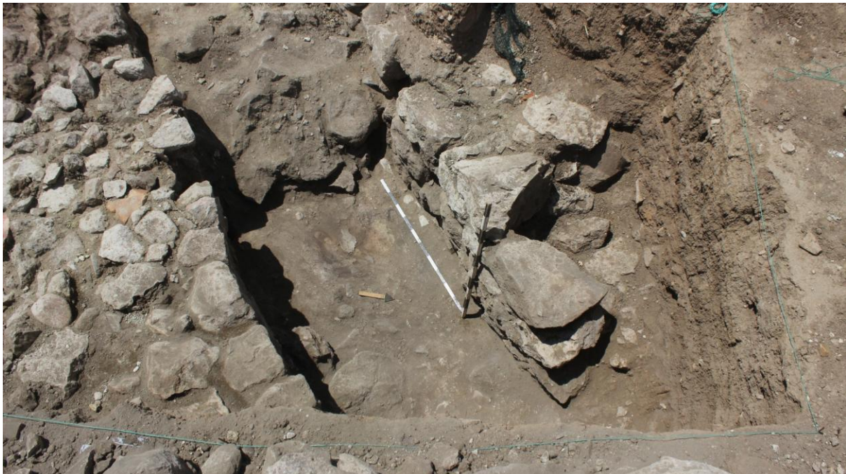
20. Сонда 37, тн, коридор, на крај на истражувањето