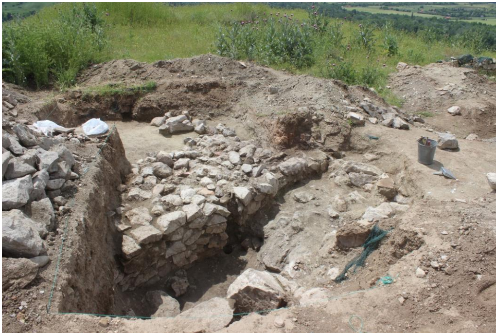
22. Сонда 37, на крај на ископувањето