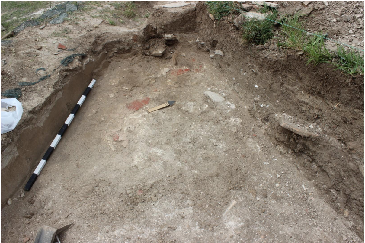
6. Сонда 33, фрагменти од боен малтер