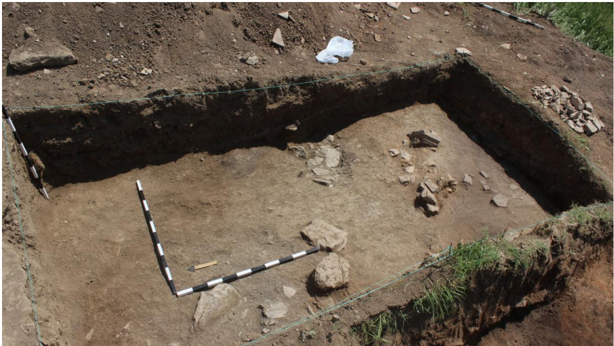
16. Сонда 37, рушевински слој