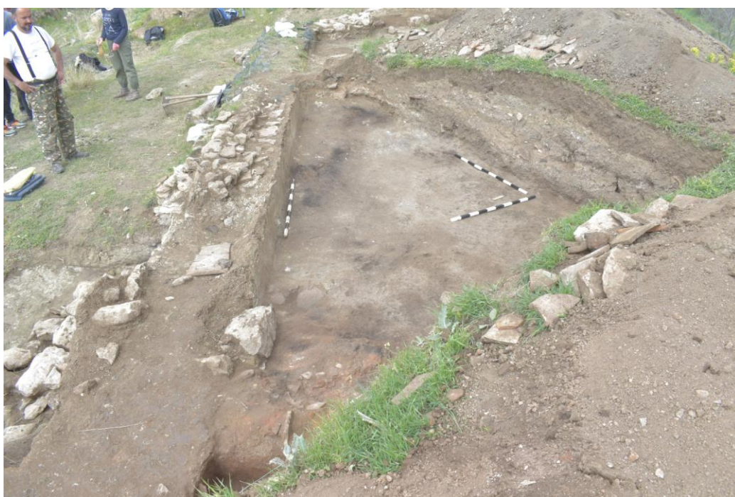
8. Сонда 33, подно ниво