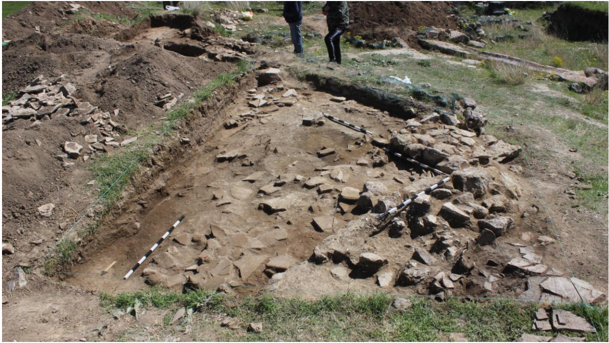
5. Сонда 34, рушевински слој