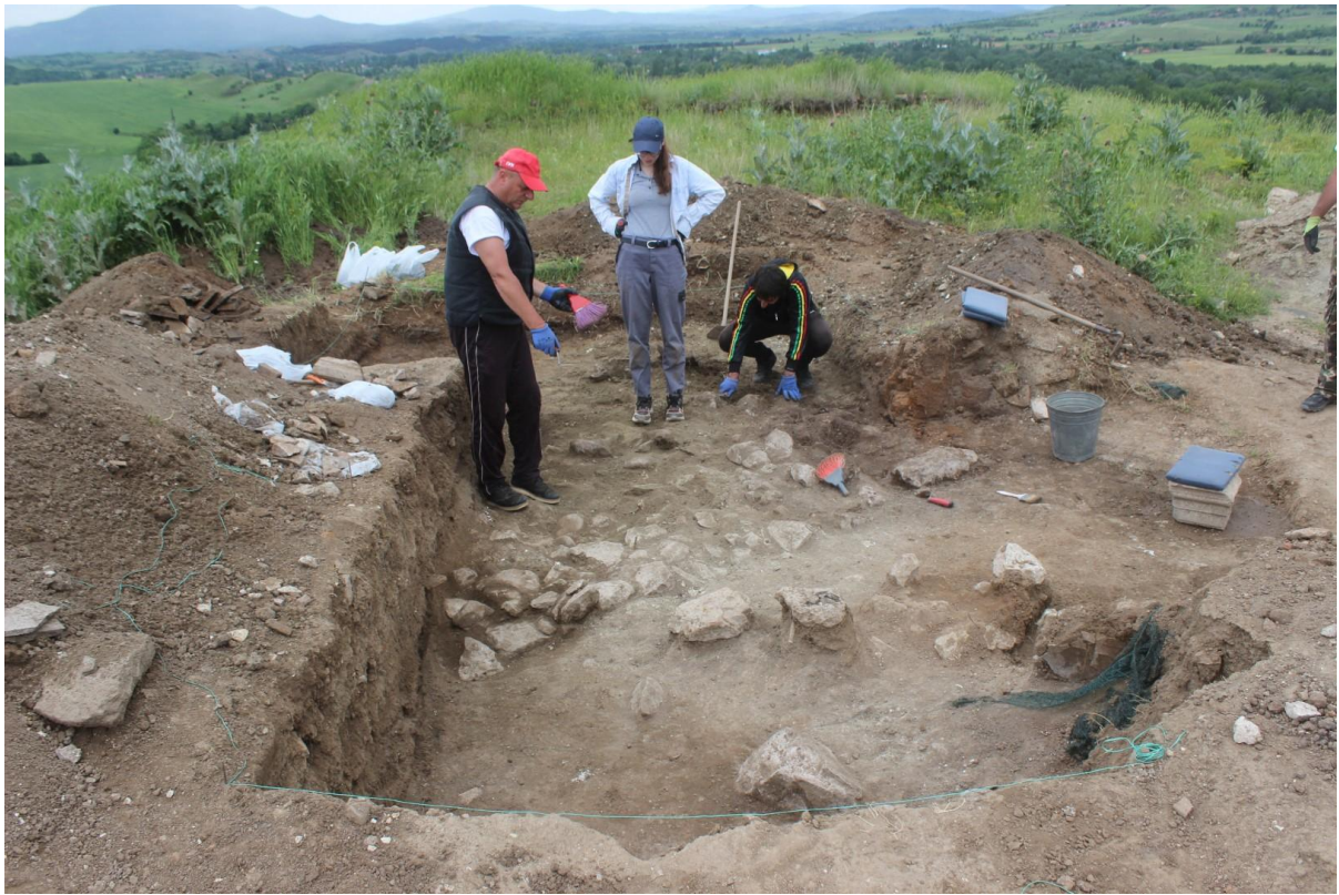
19. Сонда 37, во процес на испување на т.н. коридор (горни камења)