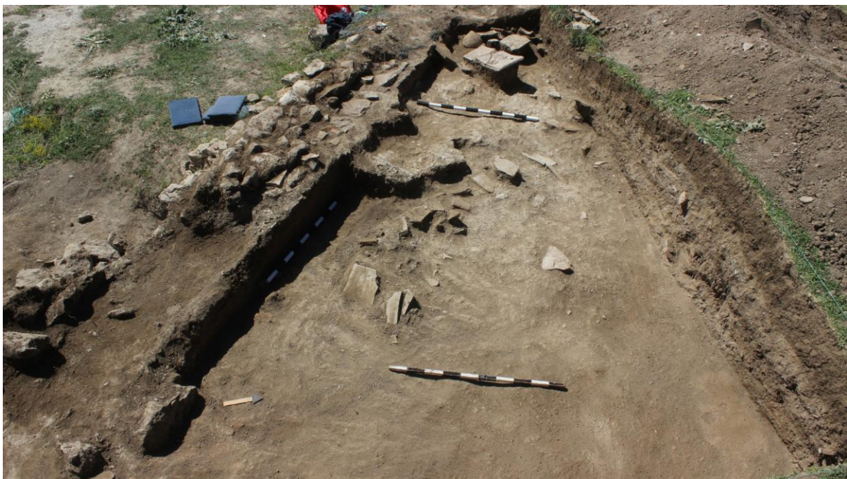
4. Сонда 33, рушевински слој