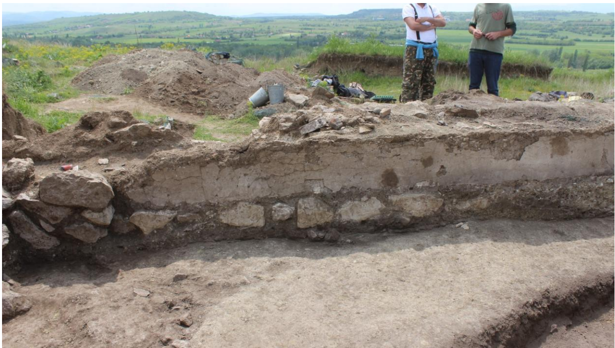
12. Сонда 33, однос на малетрниот ѕид со постарото ниво