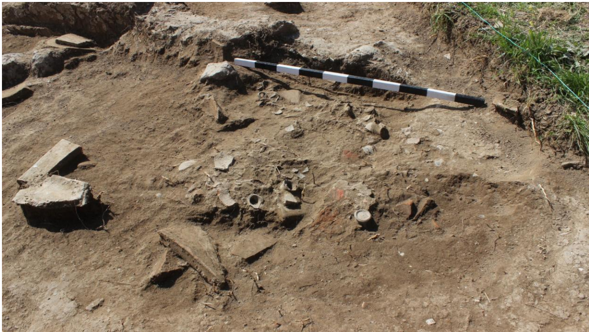
3. Сонда 34, групација од скифоси