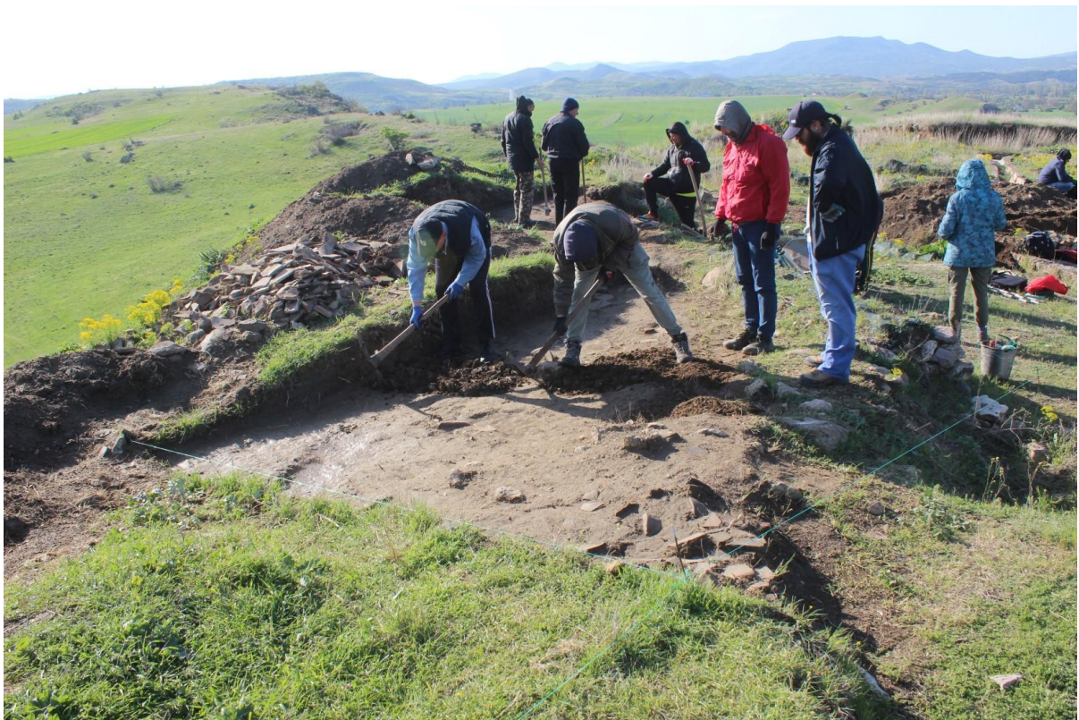
2. Соңди 33 и 34, на почеток на ископување