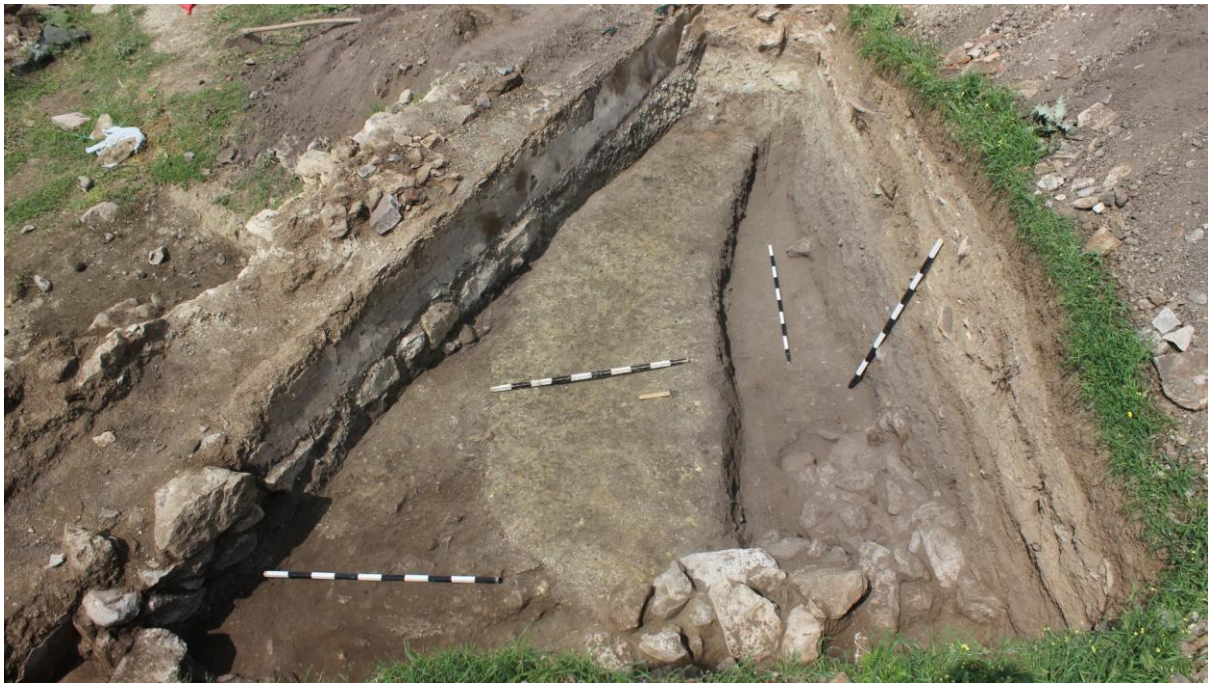
11. Сонда 33, постари слоеви – подно ниво, пресечено на северната половина