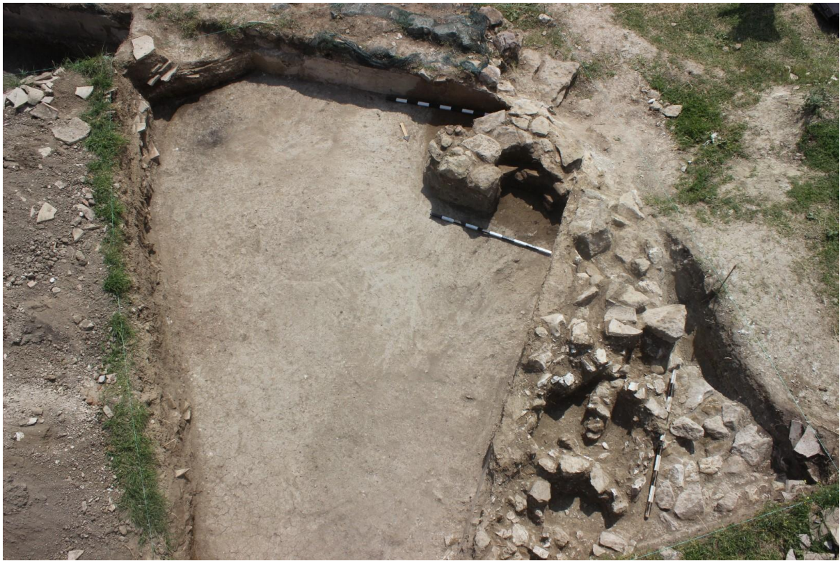
9. Сонда 34, подно ниво