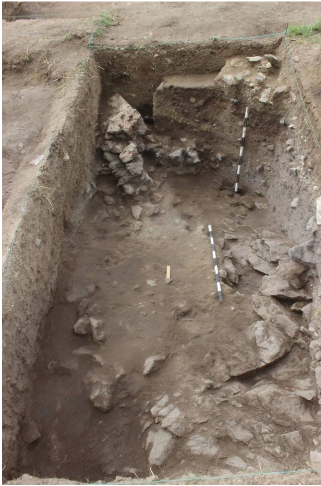
21. Сонда 36, на крај на ископувањето