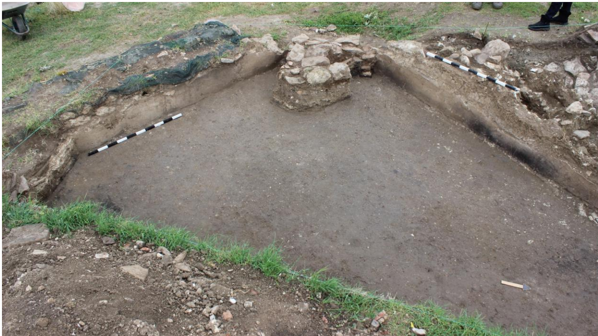
10. Сонда 34, подно ниво, од исток