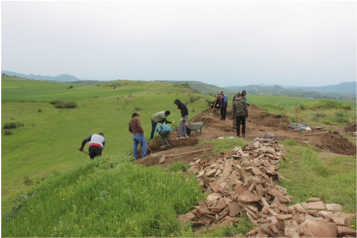
13. Сонди 36 и 35